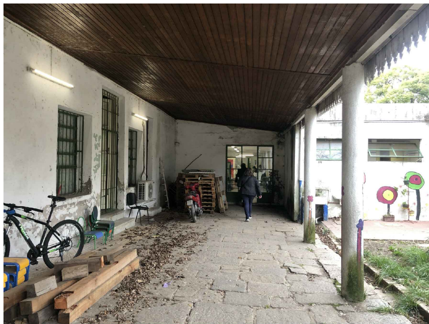
PAVIMENTO A RETIRAR Y CONSERVAR SEGUN MCP