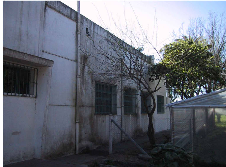
VOLUMEN A DEMOLER