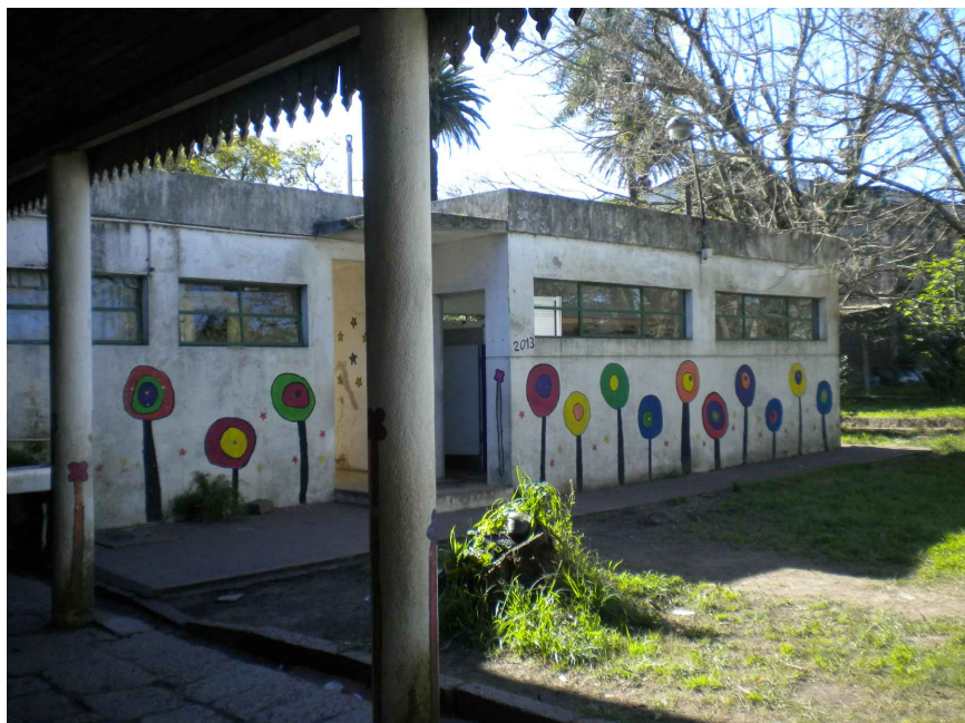
SERVICIOS HIGIENICOS A DEMOLER