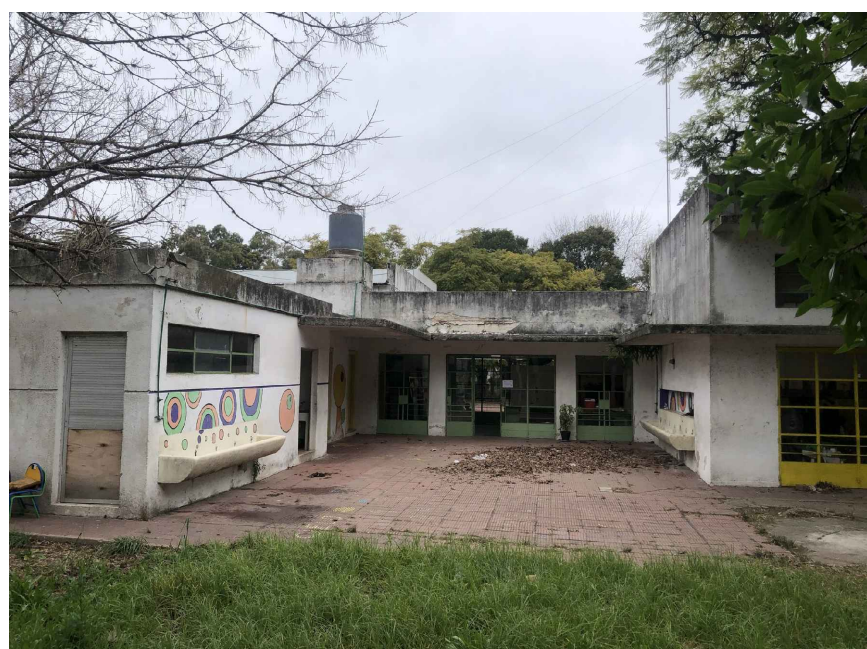
CONECTOR A DEMOLER